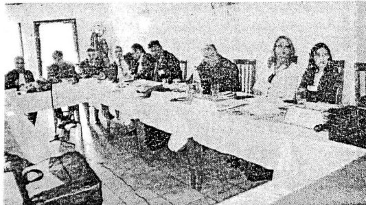
Φωτογραφικό στιγμιότυπο από την πρώτη συνάντηση των εταιρών που πραγματοποιήθηκε το ξενοδοχείο Ερωδιός στο Λιθότοπο το Σάββατοκύριακο.